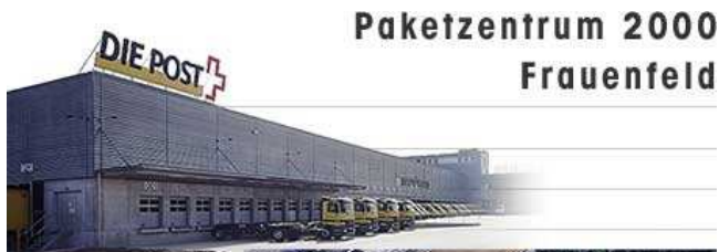
Paketzentrum 2000 Frauenfeld